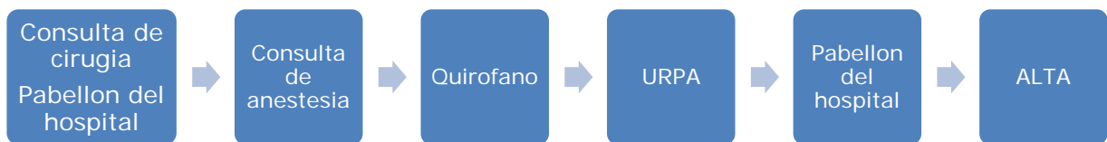
Diagrama del paciente en situación crítica